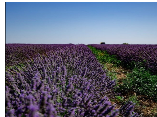
Champ de lavandin à Milly-la-Forêt

ADéPAM Association pour le Développement des Plantes Médicinales et Aromatiques à Milly la Forêt